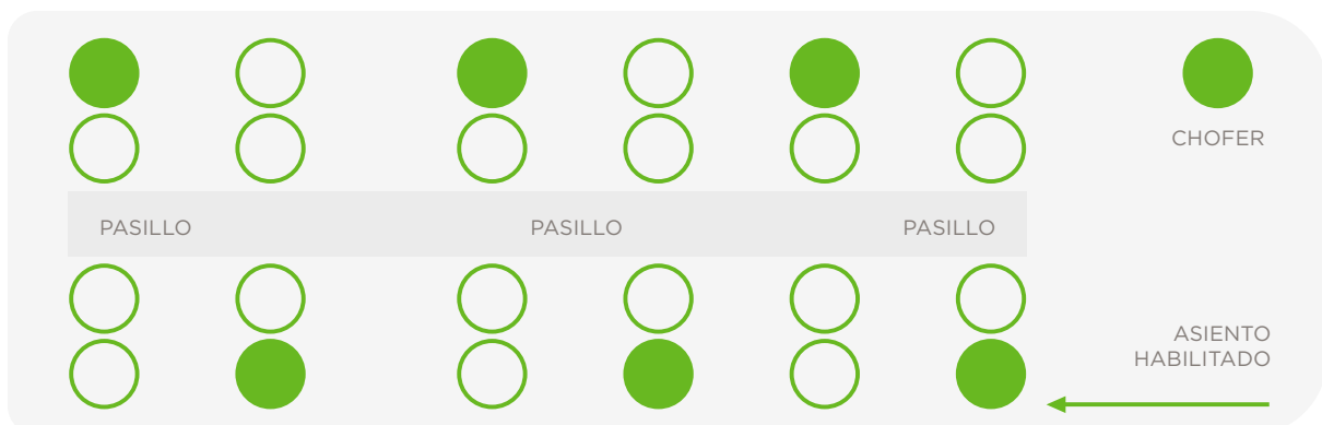
Imagen 1. Distribución recomendada para los autobuses

Si se utiliza transporte colectivo privado, se recomienda exigir al proveedor del servicio la limpieza y desinfección de las unidades antes y después de cada viaje, así como proveer suficientes unidades para que dentro de ellas se guarde una distancia de 1 m entre pasajeros, ofrecer alcohol en gel al entrar, colocar basureros con tapa y mantener todas las ventanas abiertas para mejorar la circulación de aire. La imagen 1 muestra la distribución recomendada en los autobuses.